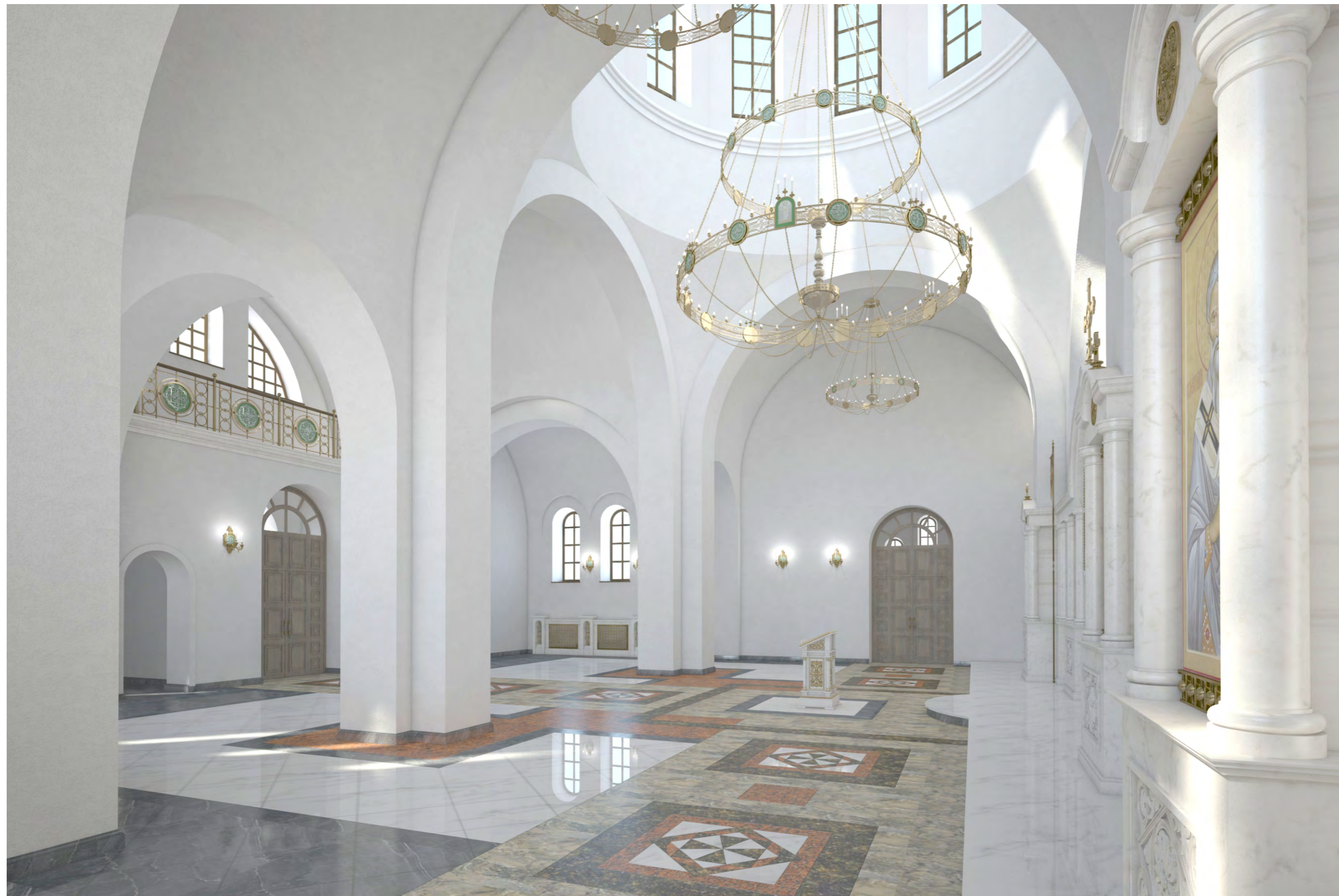
Перспектива №4. Вид с юго-восточной стороны молельного зала на входную группу и балкон хора.