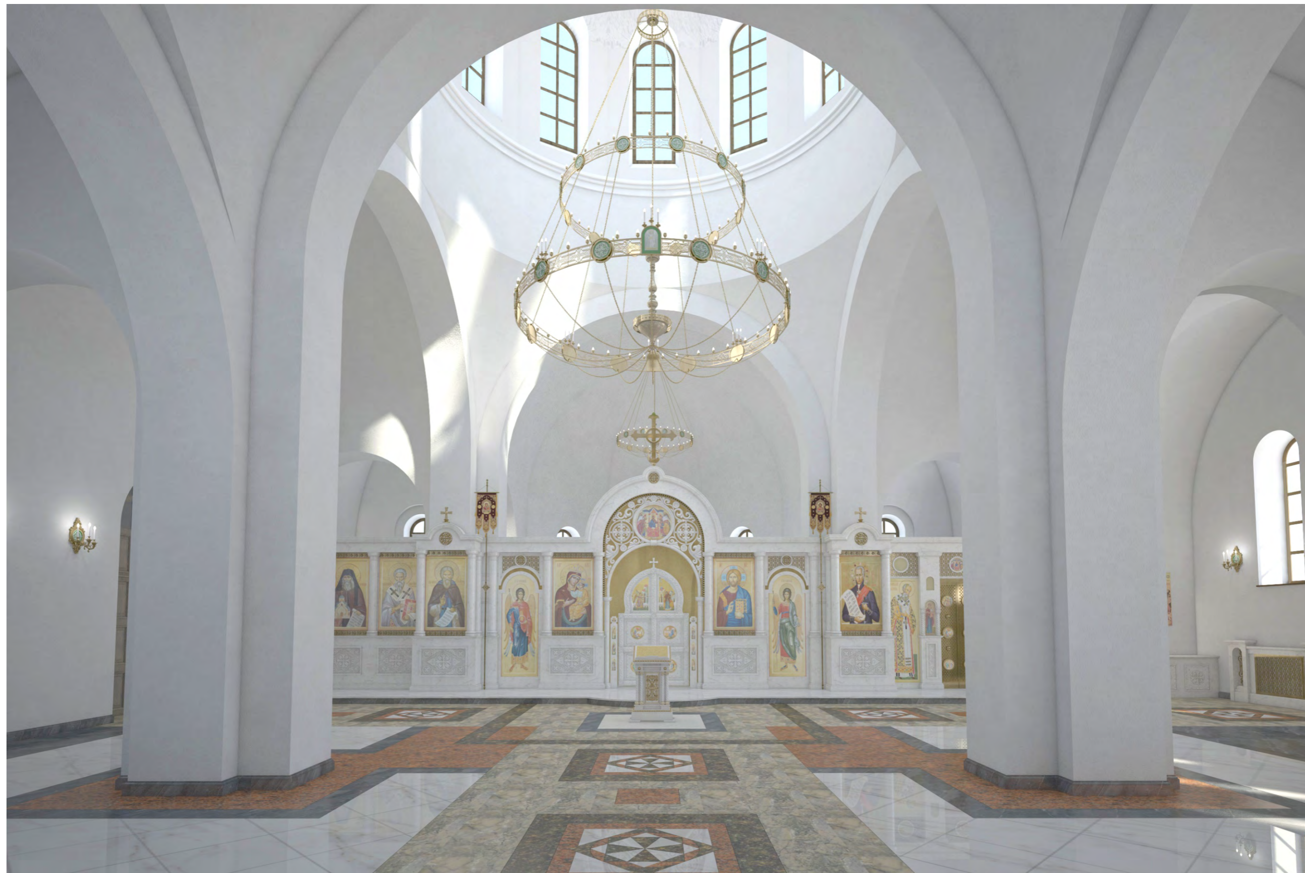
Перспектива №1 Общий вид на иконостас со стороны главного входа в храм.