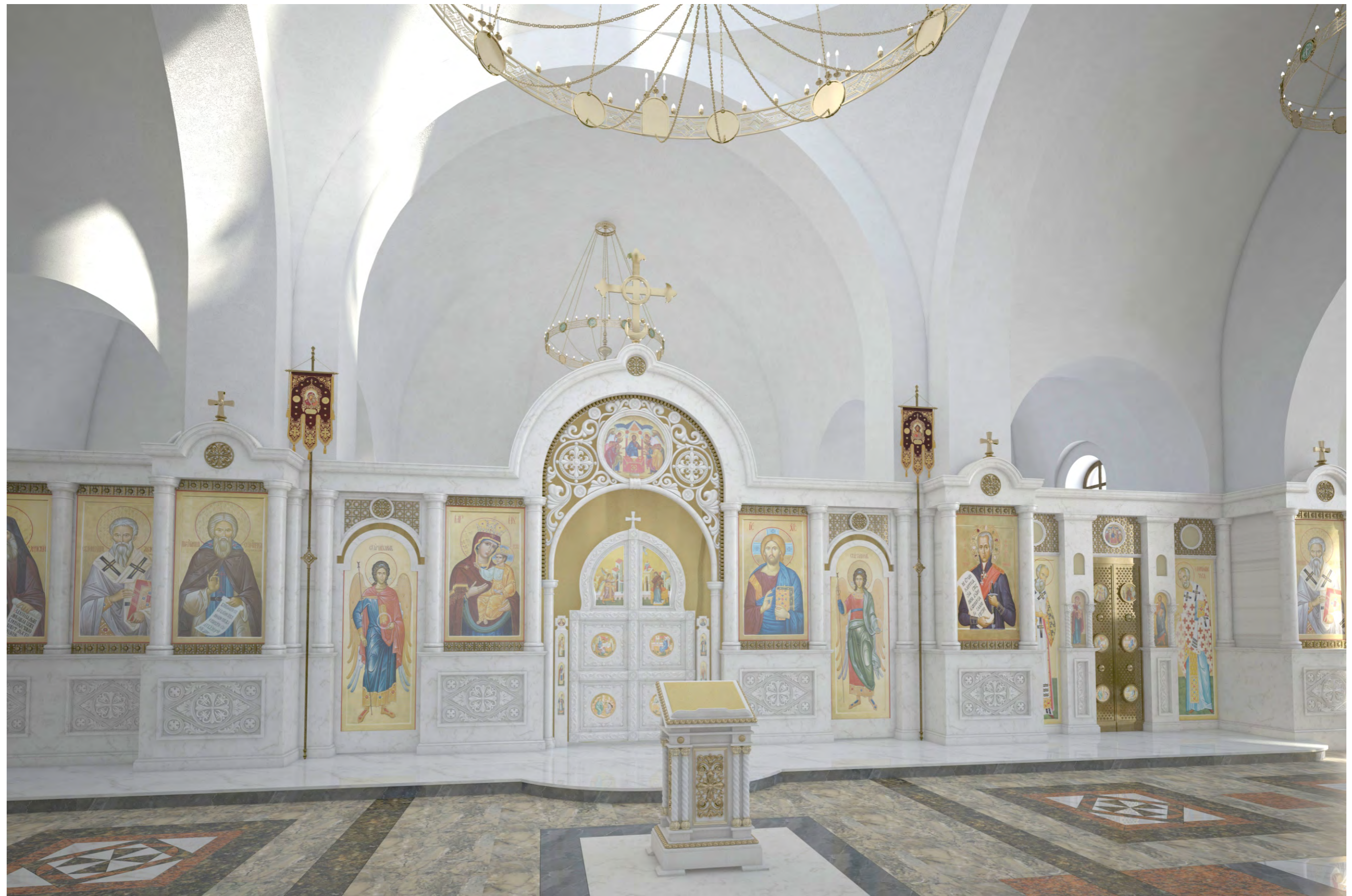
Перспектива №8. Вид на центральную часть иконостаса.