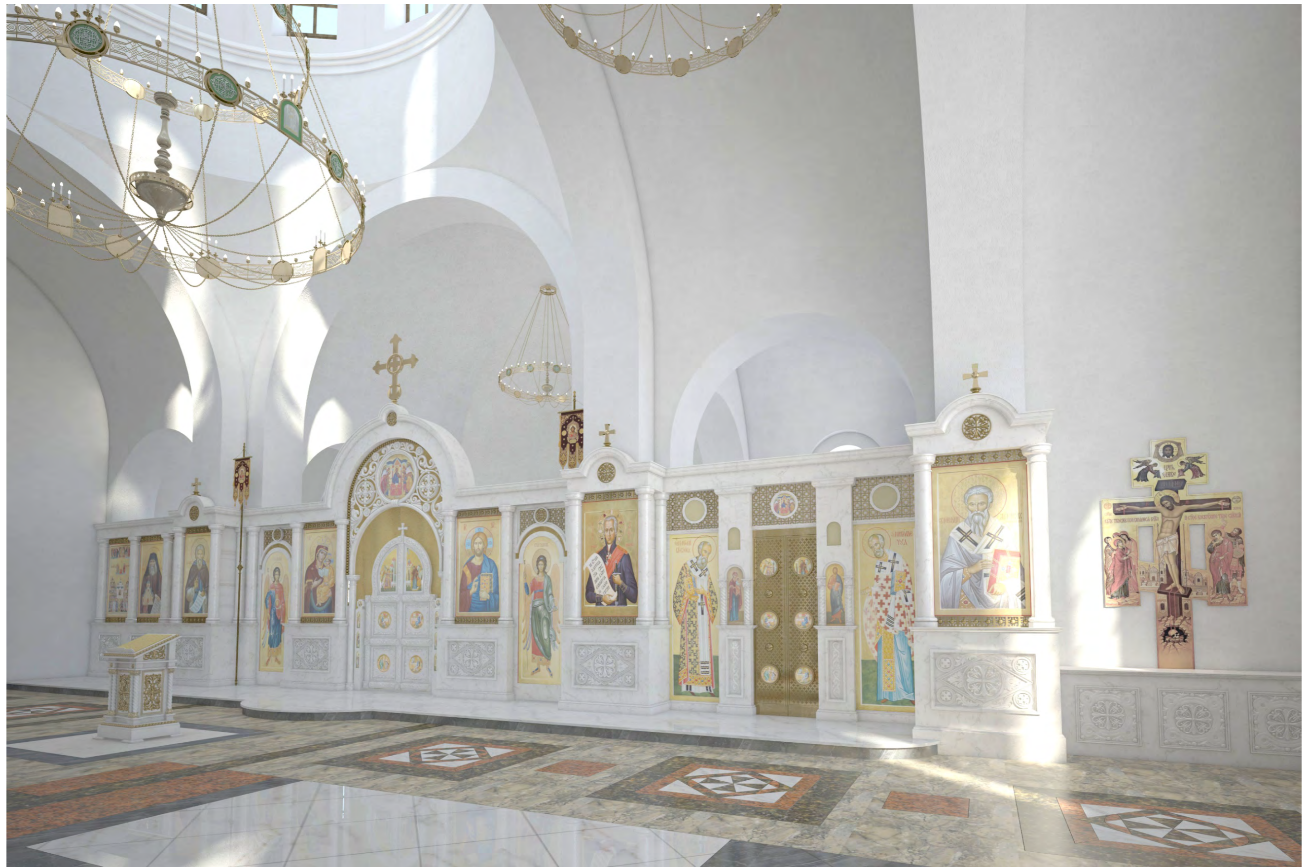
Перспектива №2. Общий вид иконостаса со стороны южного входа.