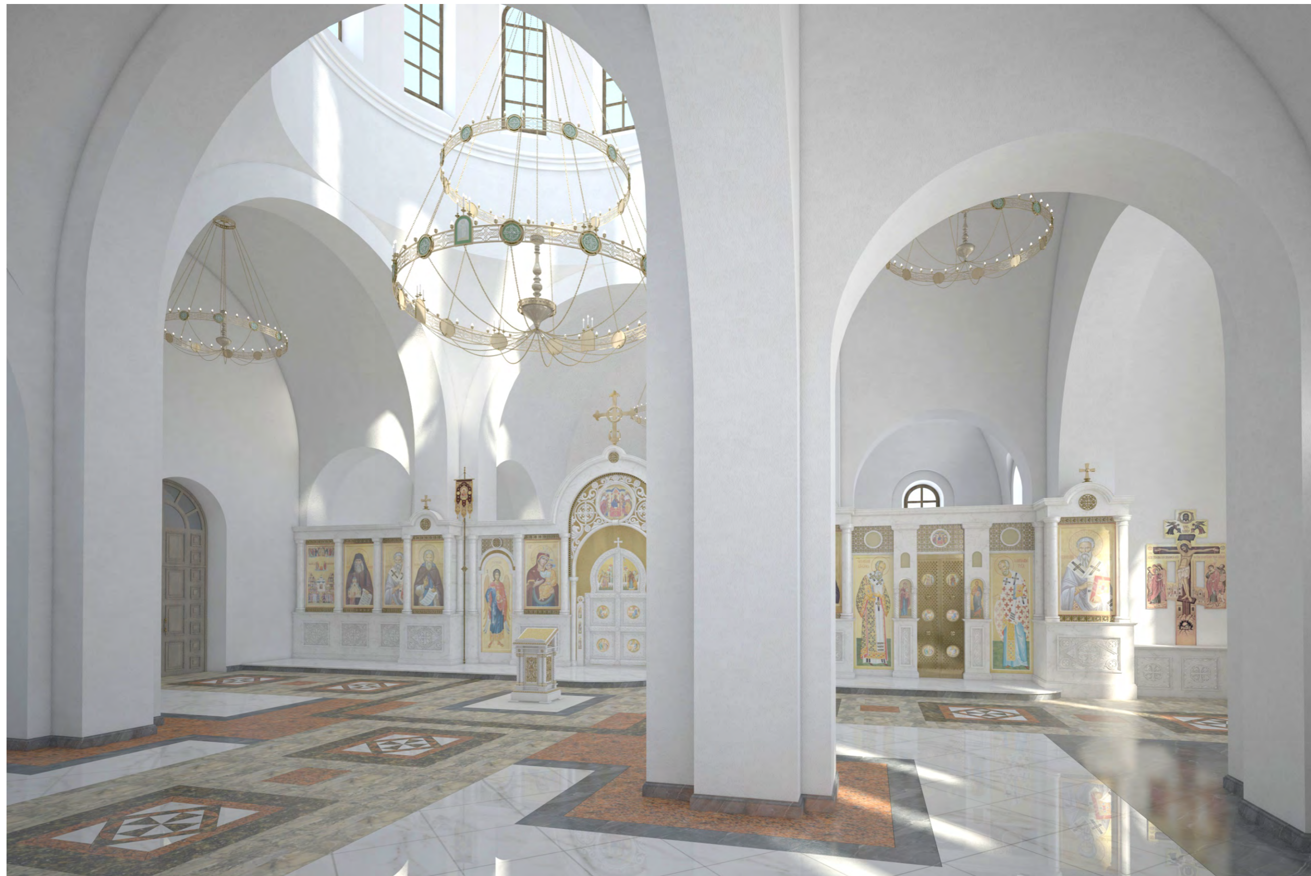
Перспектива №5. Вид на иконостас с юго- западной стороны молельного зала.