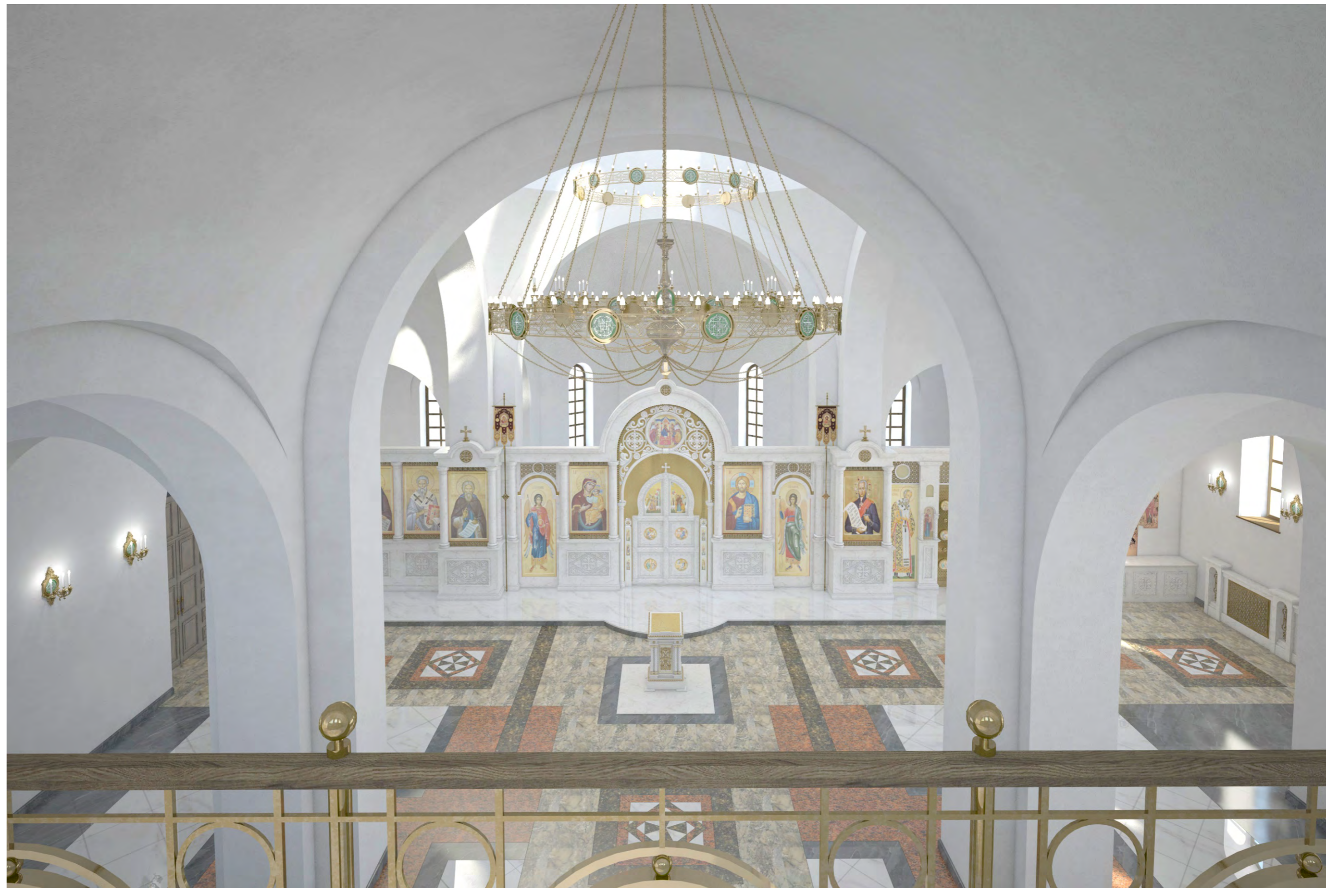
Перспектива №6. Вид на иконостас с балкона хора.