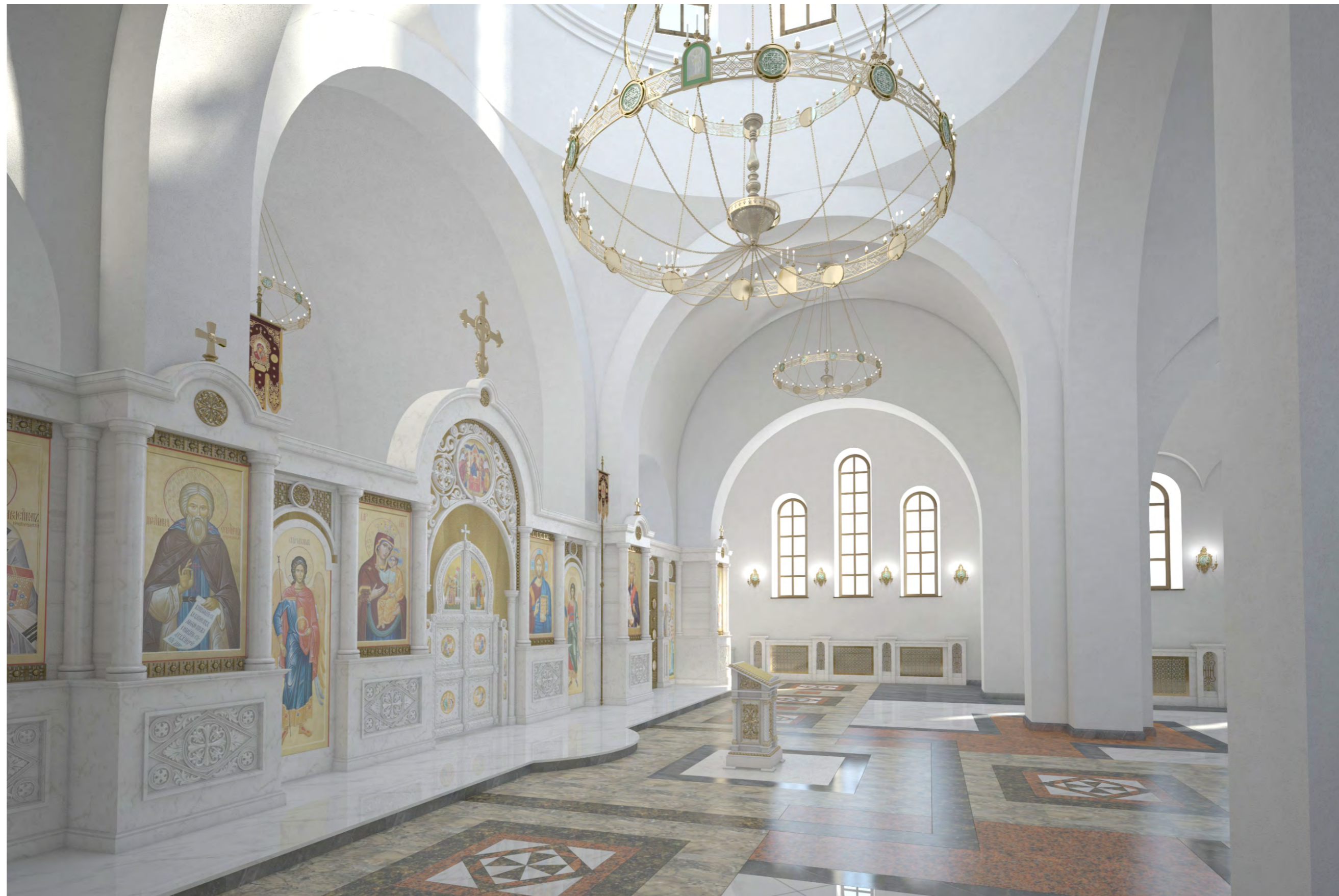
Перспектива №7. Вид на молельный зал с северного бокового входа.