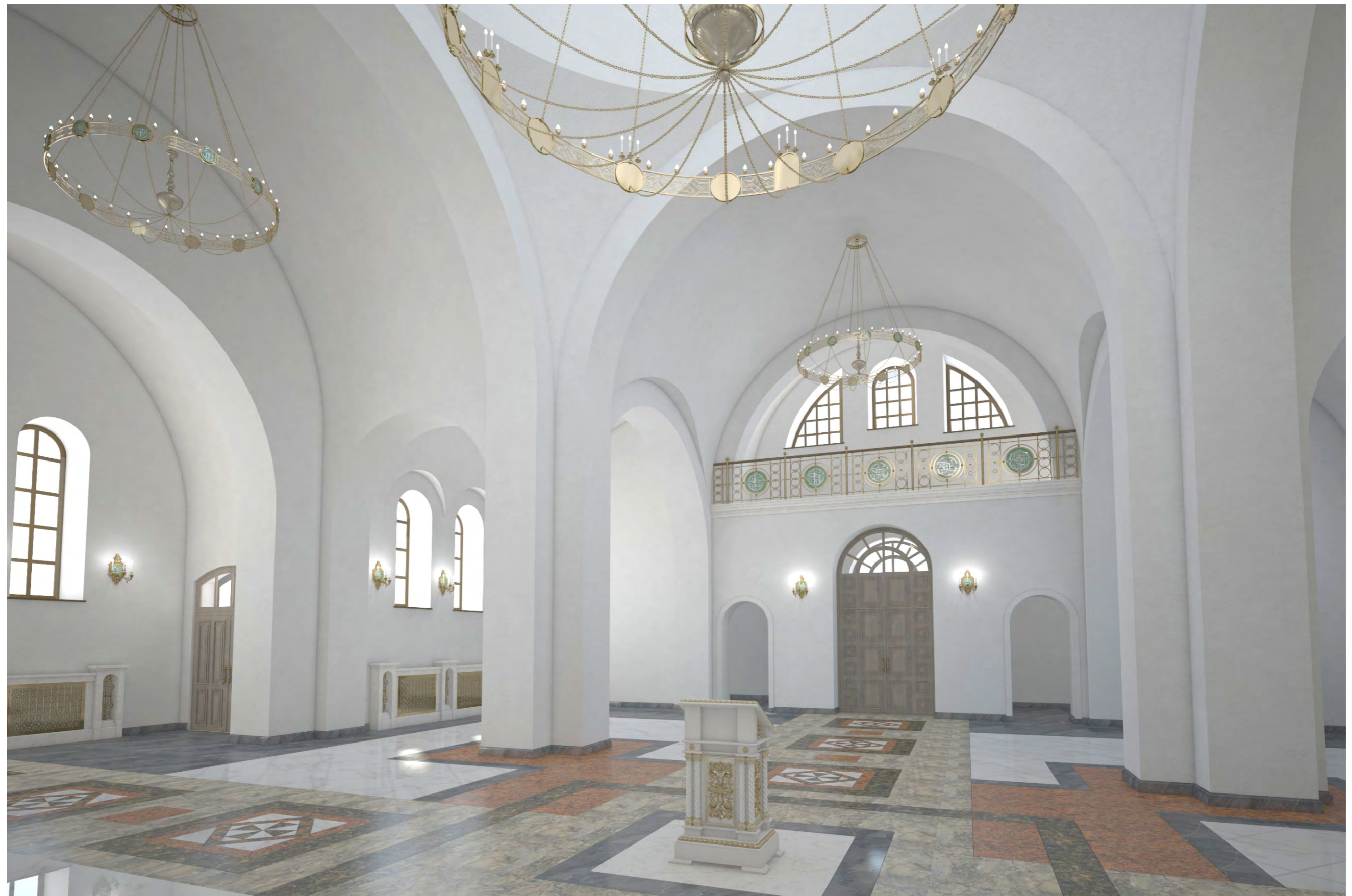
Перспектива №3. Вид с амвона на входную группу и балкон хора.